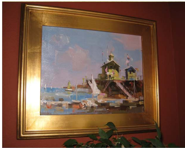
連續三年被全美油畫家協會 (OPA) 選中參展。