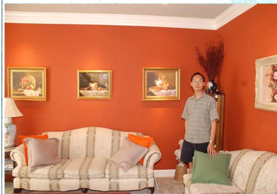
裝潢新家是他學畫的動力之一。