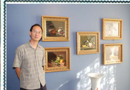
強的繪畫副業所得已超過本業。